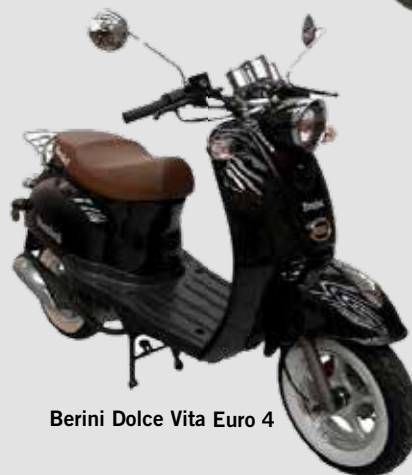
Berini Dolce Vita Euro 4