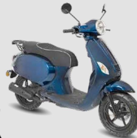
VX50 Plus (injectie)