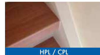
HPL / CPL

Wij werken met verschillende soorten materialen, zoals eikenhout, PVC en HPL/CPL, om uw trap weer veilig, mooi en slijtvast te maken. Naast ledverlichting voor de trap hebben we ook bijpassend laminaat en trapleuningen in RVS of (blauw)staal.