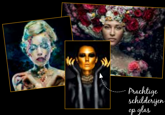
Prachtige schilderijen op glas