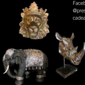
Steeds verrassende artikelen